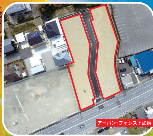
アーバン・フォレスト加納